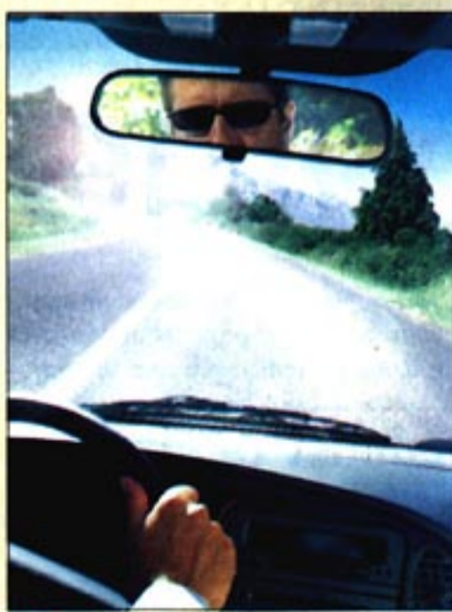
OBIČNE LEĆE sunčanih naočala ne štite od refleksije sunčanih zraka

P olarizirane naočalne leće za sunce smanjuju blještanje uzrokovano refleksijom sa površine poput snijega, mora ili pijeska. Upravo zbog tog svojstva one poboljšavaju komfor i pružaju dodatnu sigurnost. Također zbog smanjenja odbijanja čine boje koje se nalaze u okolini bogatijima i potpunijima. Ovaj tip leća posebno je pogodan za osobe koje žive aktivno, bave se sportom, ribolovom, krstarenjima i drugim aktivnostima na otvorenom.